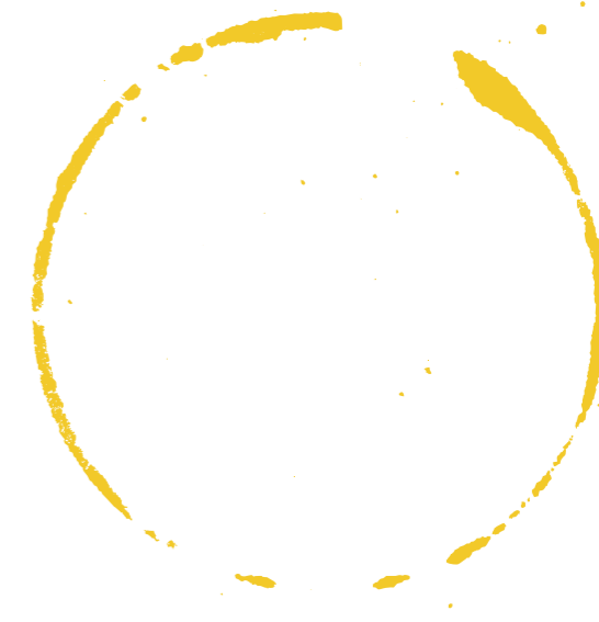
BARTH RIESLING FRUCTUS Qualitätswein Rheingau, Saksa

Weingut Winter Riesling Trocken Saksan Rheinhessenistä ilmentää upeasti juuri sitä kasvuympäristöä mistä se tulee. Winterin suvun viiniviljelyperinteet yltyvät aina 1600-luvulle saakka. Tuoksusta tai mausta voi poimia kaikki tyypilliset Rieslingin ominaisuudet: sitrus, vihreä omena, hapokkuus ja mineraalisuus.