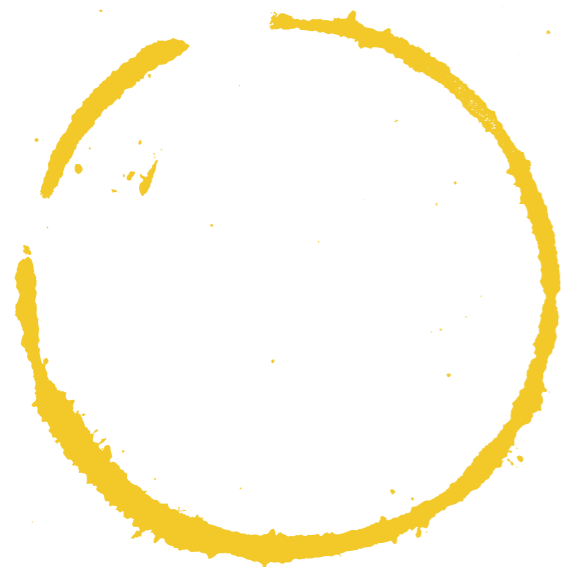
WOLFBERGER RIESLING SIGNATURE AOC Alsace, Ranska

Wolfberger Riesling Signature -viini tulee Ranskan Alsacesta. Se on siitä erityinen, että joka sadonkorjuun jälkeen viinin maistaa ja valitsee erityinen raati, joka koostuu viinialan parhaista ammattilaisista. Viinissä voit haistaa tai maistaa muun muassa sitrusta, hunajaisuutta ja mineraalisuutta.