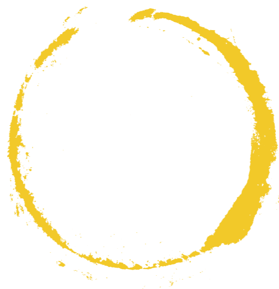
WEINGUT WINTER RIESLING TROCKEN Qualitätswein Rheinhessen, Saksa