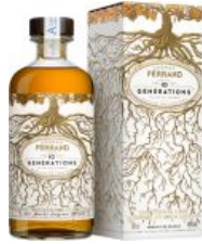
Ferrand 10 Generations