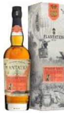
Plantation Stiggin's Fancy Smoky Formula