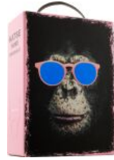
Katse Rosé Organic hanapakkaus