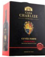
Casa Charlize Cuvee Forte Toscana Rosso IGT BIB