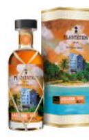
Plantation Extreme Series Barbados 1986