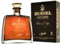
Busnel Hors d'Age Calvados