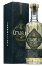
Citadelle Gin Reserve