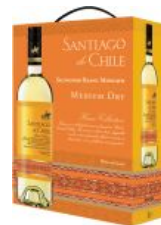
Santiago De Chile White