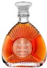
Camus Borderies XO Family Reserve mini