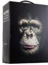
Katse La Mirada Tempranillo Syrah BIB