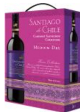
Santiago De Chile Red